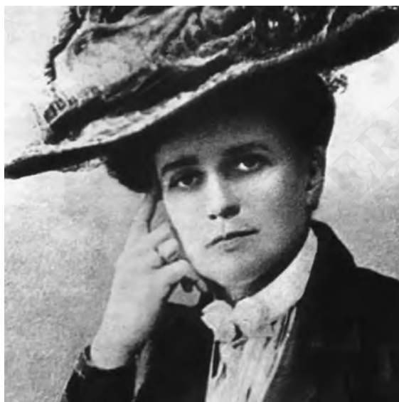
Ksénia Mikhaïlovna Sadovskaïa (1859-1925)